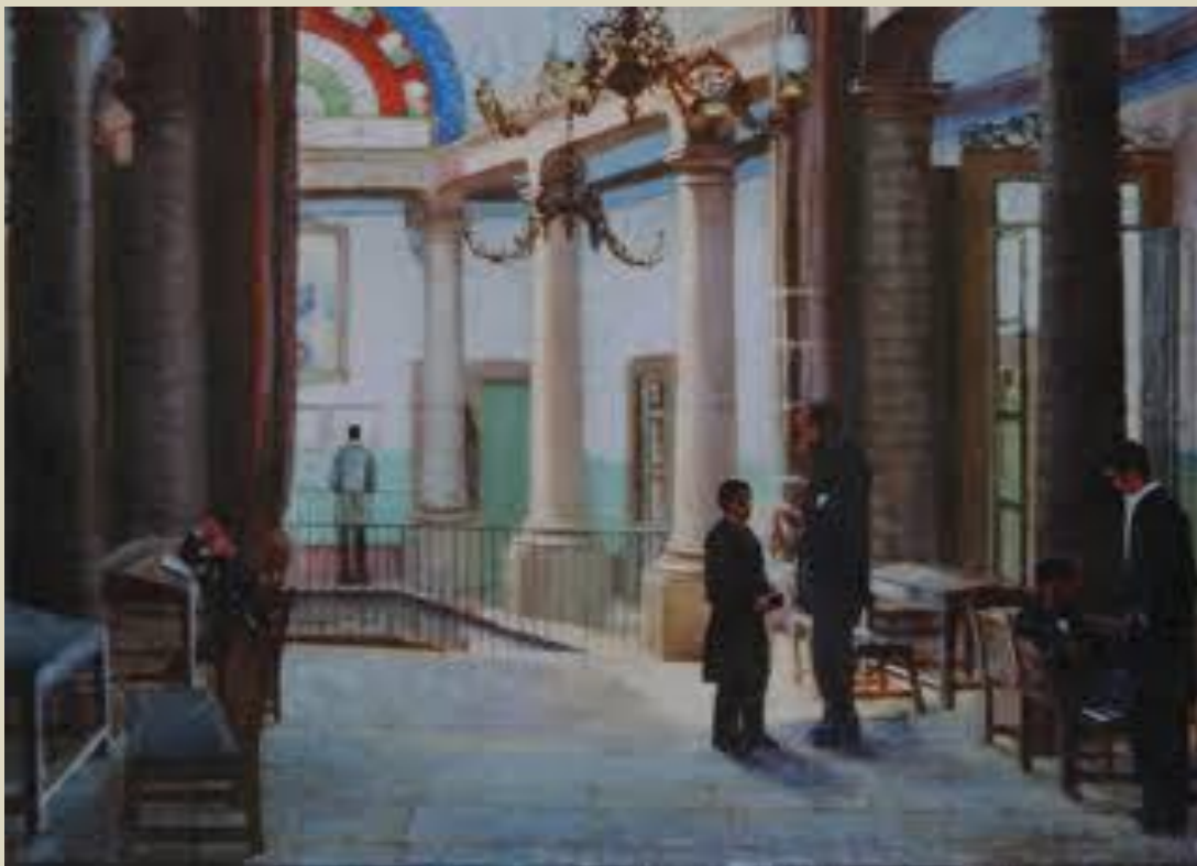
Pintura que muestra el patio interior o patio de estudios del Colegio del Estado